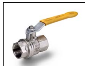
Gaskogelkraan met EN 331 keur