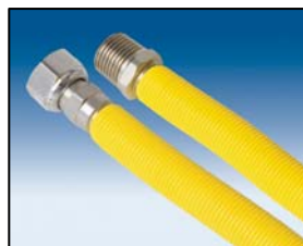
Rvs gasaansluitleiding ProFlex